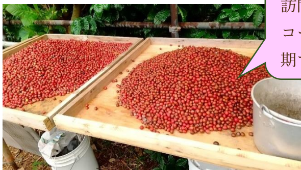
収穫したコーヒーの実

コーヒーやローゼル（食用ハイビスカス）の栽培も手掛けています。自家栽培したコーヒーは、お店で飲むことができます（※生産状況により提供できないこともあります）。