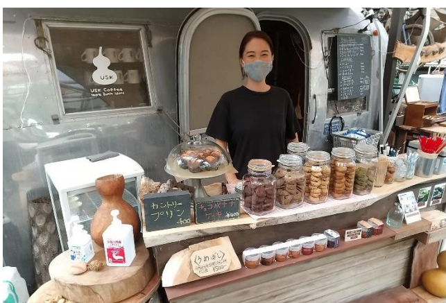
店に並ぶ手作りのお菓子