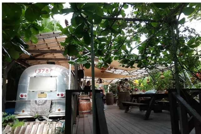
店の前にある大きなモモタマナの木